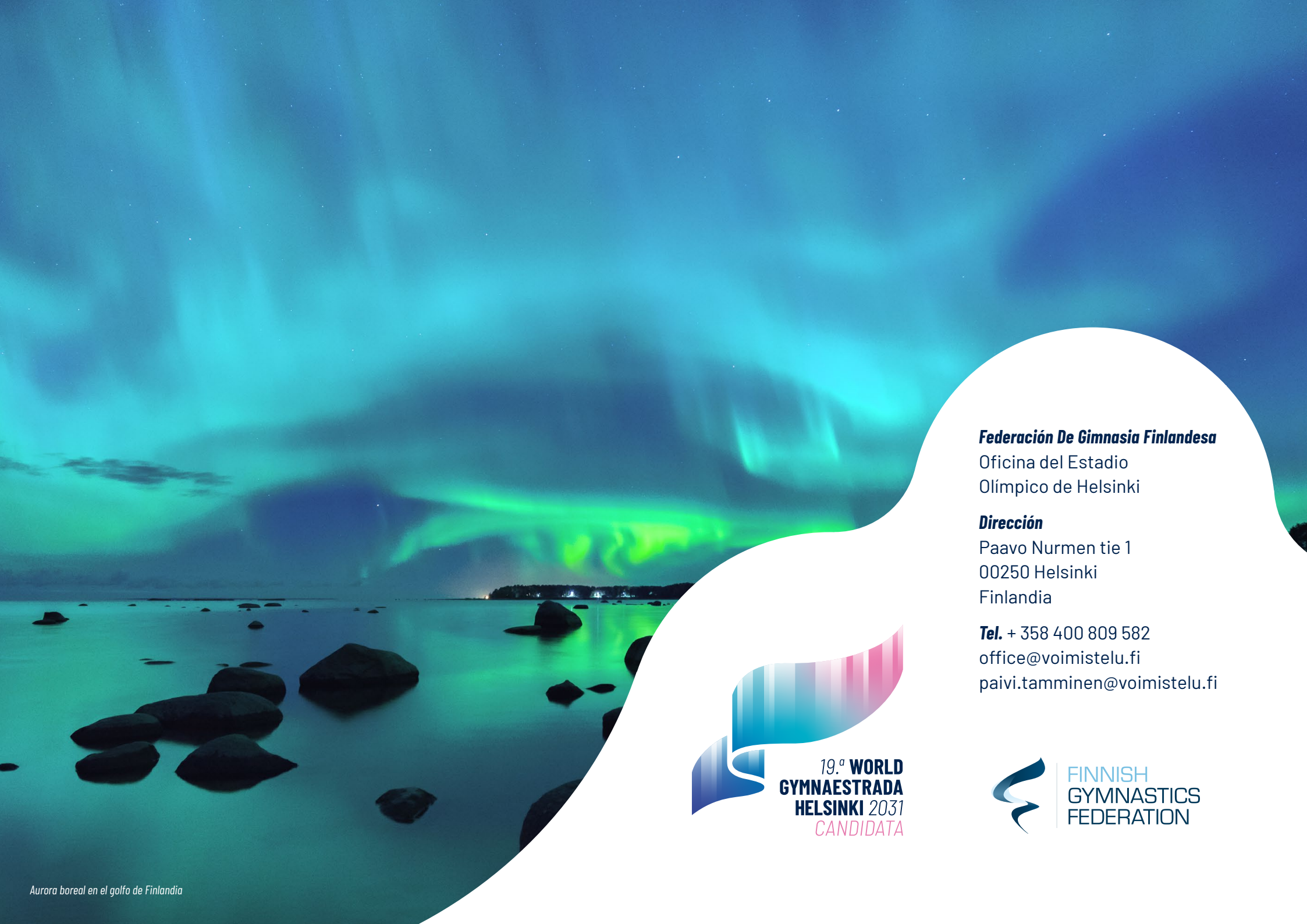
Aurora boreal en el golfo de Finlandia