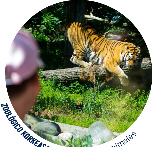
ZOOLOGICO KORKEASAARI: la isla de los animales