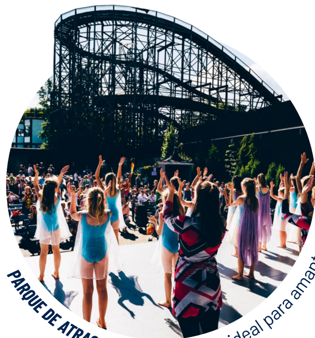
PARQUE DE ATRACCIONES LINNANMÄKI: ideal para amantes de la diversión