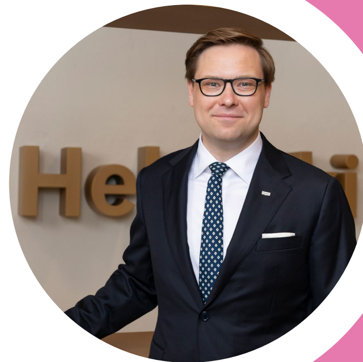
Daniel Sazonov Alcalde de Helsinki

Helsinki ya tuvo el placer de organizar la World Gymnaestrada en el año 2015. Invito de todo corazón a que vuelva a Helsinki de nuevo. En nuestra ciudad haremos todo lo posible para que todos los participantes disfruten de su estancia y cosechen grandes éxitos.