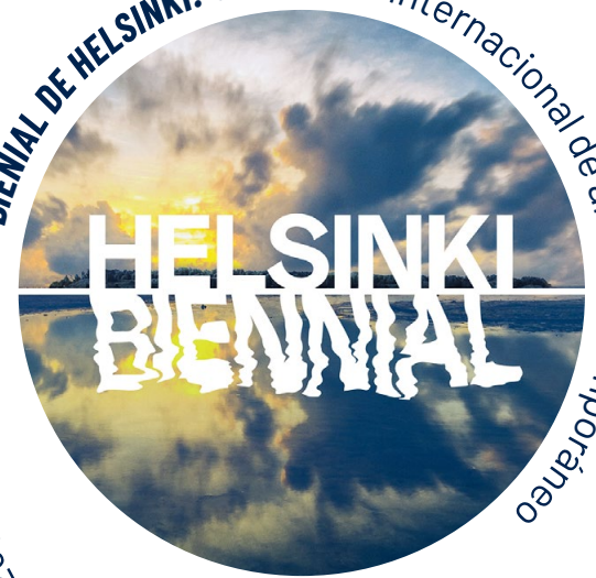
BIENAL DE HELSINKI: un evento internacional de arte contemporáneo