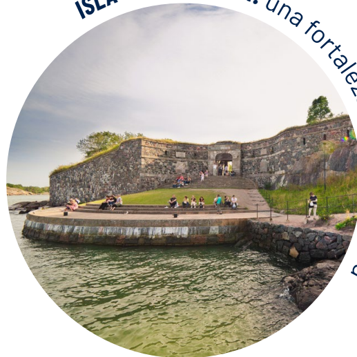
ISLA SUOMENLINNA: una fortaleza marítima única